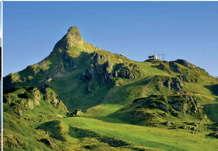
Herrlicher Ausblick auf die Seekarspitze